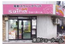
東京ショールーム

■東京ショールーム 東京都大田区大森北3-9-12 電 話: 03-6423-1401